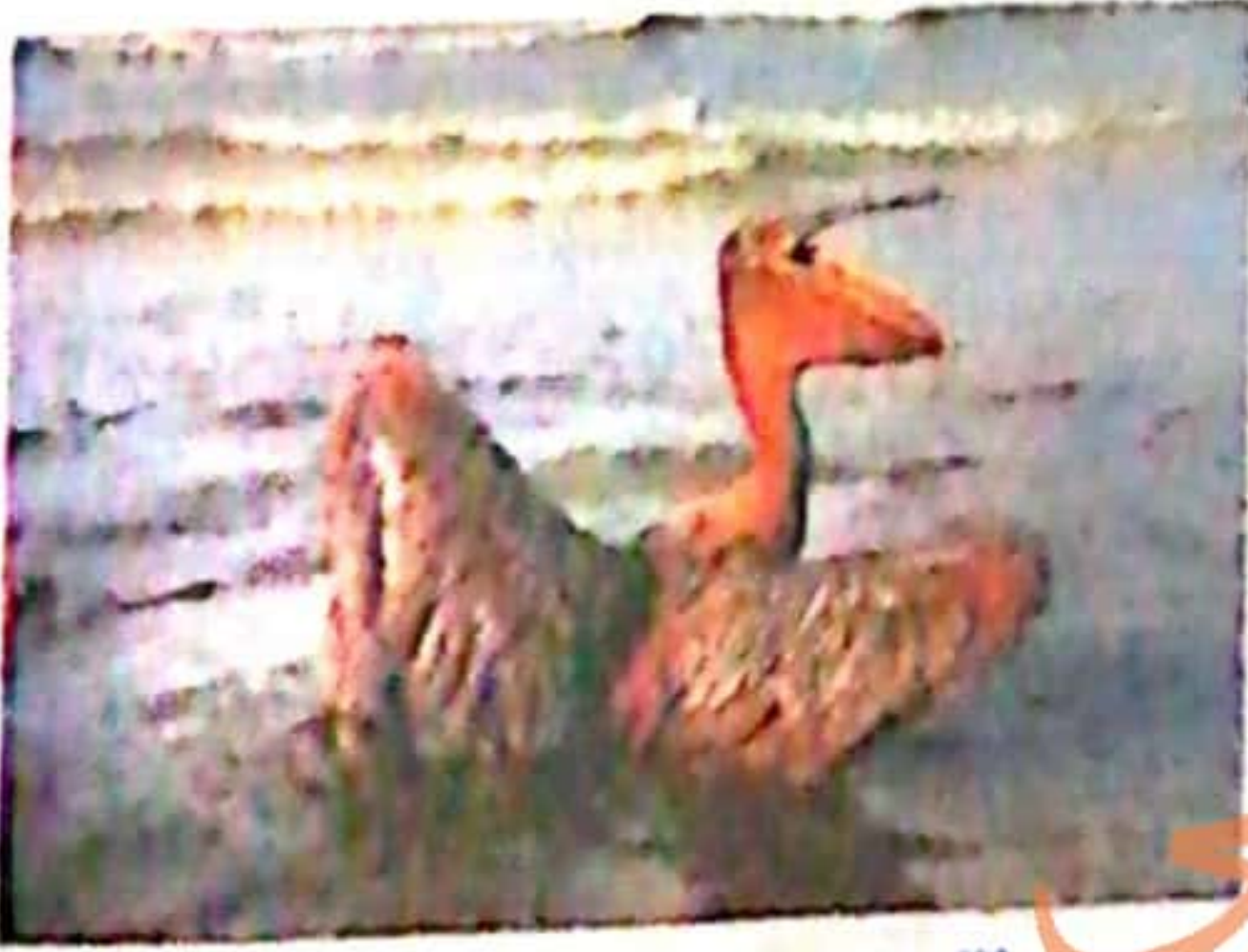
طائر بحري غارق في بقعة نمطية

٣٢ تشير الصورة التي أمامك إلى أحد سلبيات التنمية ..... أ) البيئية. ب) الاقتصادية. ج) البشرية. د) المستدامة.